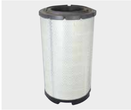
Scania Liderpar LPF 3720