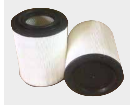
Mitsubishi Canter Liderpar LPF 3727