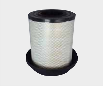
Mercedes Atego2 - Axor2 Liderpar LPF 3710