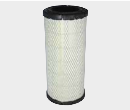
Iveco Daily Liderpar LPF 3716