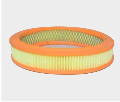
Tofaş SLX Liderpar LPF 3714