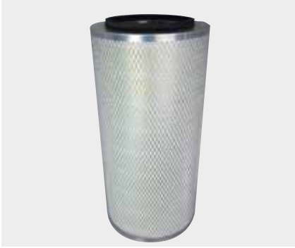
403 Otobüs Hino Kamyon Liderpar LPF 3704