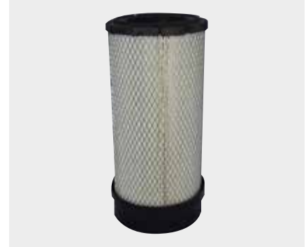
Karsan Jest Liderpar LPF 3721