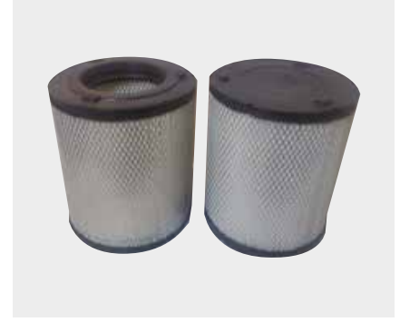
Isuzu Nqr Hava Filtresi Liderpar LPF 3724