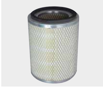
Hino Liderpar LPF 3705