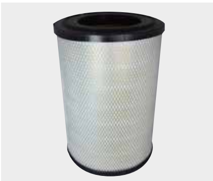
Renault Tir Kısa Liderpar LPF 3707