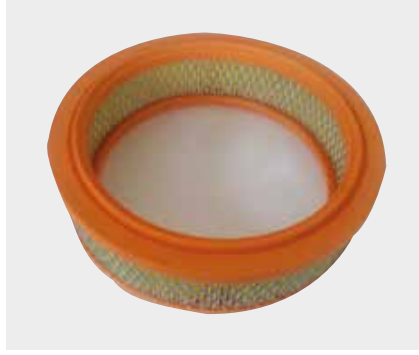
Lada Samara Air Filter Liderpar LPF 3723