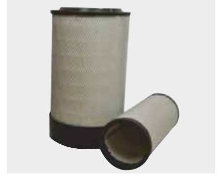
Ford Cargo Büyük Tas Liderpar LPF 3703