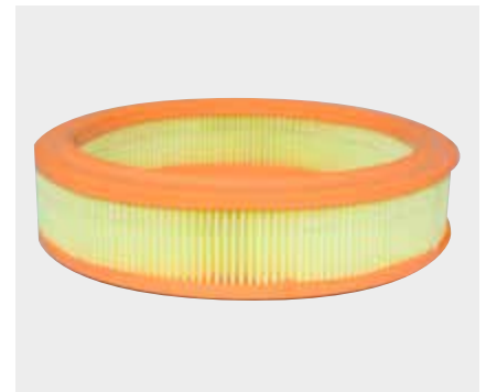
Renault 9 Liderpar LPF 3709