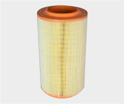
Fiat Ducato - Jumper - Boxer Liderpar LPF 3719