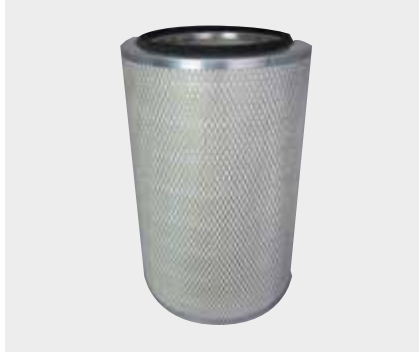
Mercedes 905 Liderpar LPF 3711