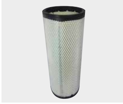
Ford Cargo İç Filtre Liderpar LPF 3702