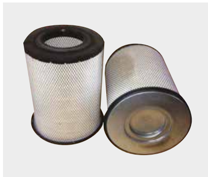
Volvo Penta Liderpar LPF 3729