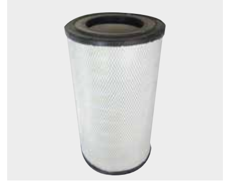
Renault Premium Uzun Tir Liderpar LPF 3706