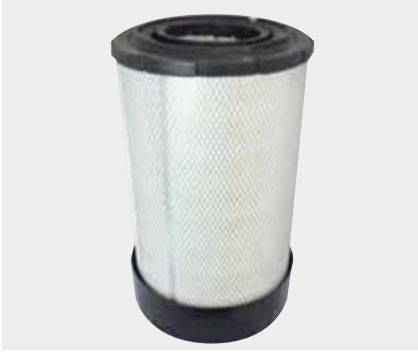
Ford Cargo Küçük Tas Liderpar LPF 3701

Hava Filtrelerinin mikronik özelliğe sahip sayısı sayesinde, motor içerisinde aşınma ve korozyon önlenir. Bu sayede motor hem çalışma esnasında gücünden kaybetmeden performans gösterir hemde yıllar boyu randımanlı verim sağlar.