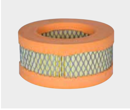
Mercedes Atego2 - Axor2 Liderpar LPF 3722

Başta beyaz eşya sektörü olmak üzere, çeşitli uygulamalarda kullanılan Elektrostatik Toz Boyama işlemi için, kabin içerisinde homojen bir ortam sağlanarak işlem yüzey kalitesini artırmak, kullanılan hammaddeden tasarruf sağlamak ve sağlıklı bir çalışma ortamı oluşturmak üzere kullanılan filtrelerdir.