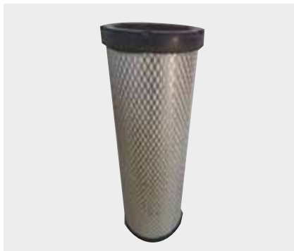
Renault Premium Uzun Tir Liderpar LPF 3708