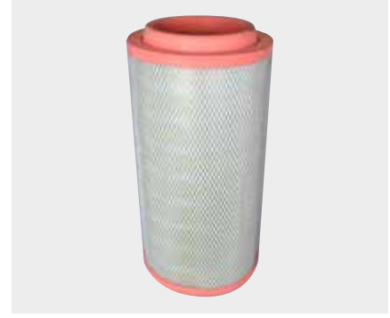
Mercedes Axsor 1840 Liderpar LPF 3712