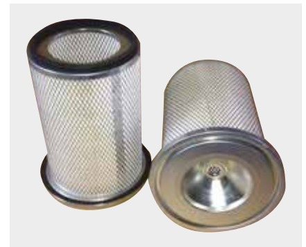
Isuzu NPR Liderpar LPF 3730