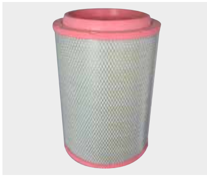
Iveco Stralis Liderpar LPF 3717