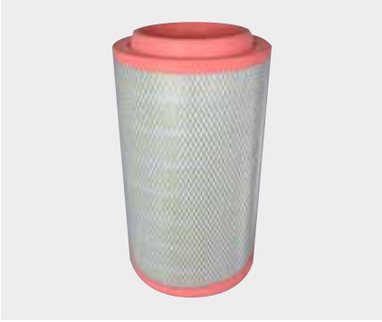
Mercedes Tourismo Liderpar LPF 3713