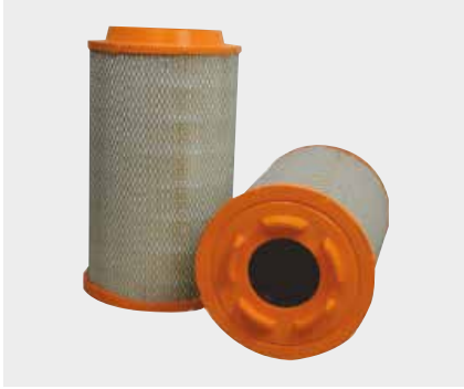
Man Tga Liderpar LPF 3725