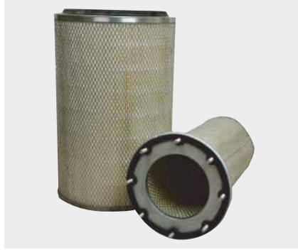
BMC Pro Liderpar LPF 3726