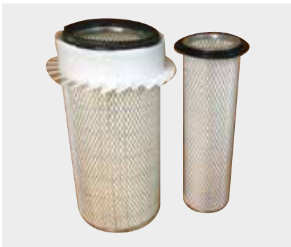
Komatsu İş Makine Filtresi Liderpar LPF 3728